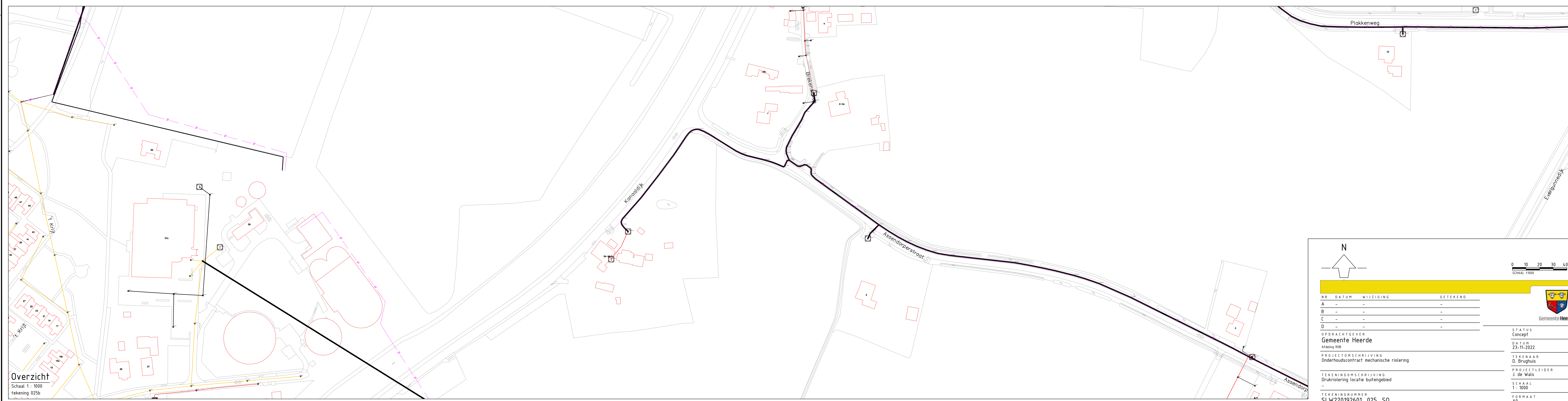
Overzicht Schaal 1: 1000 Tekening 025b