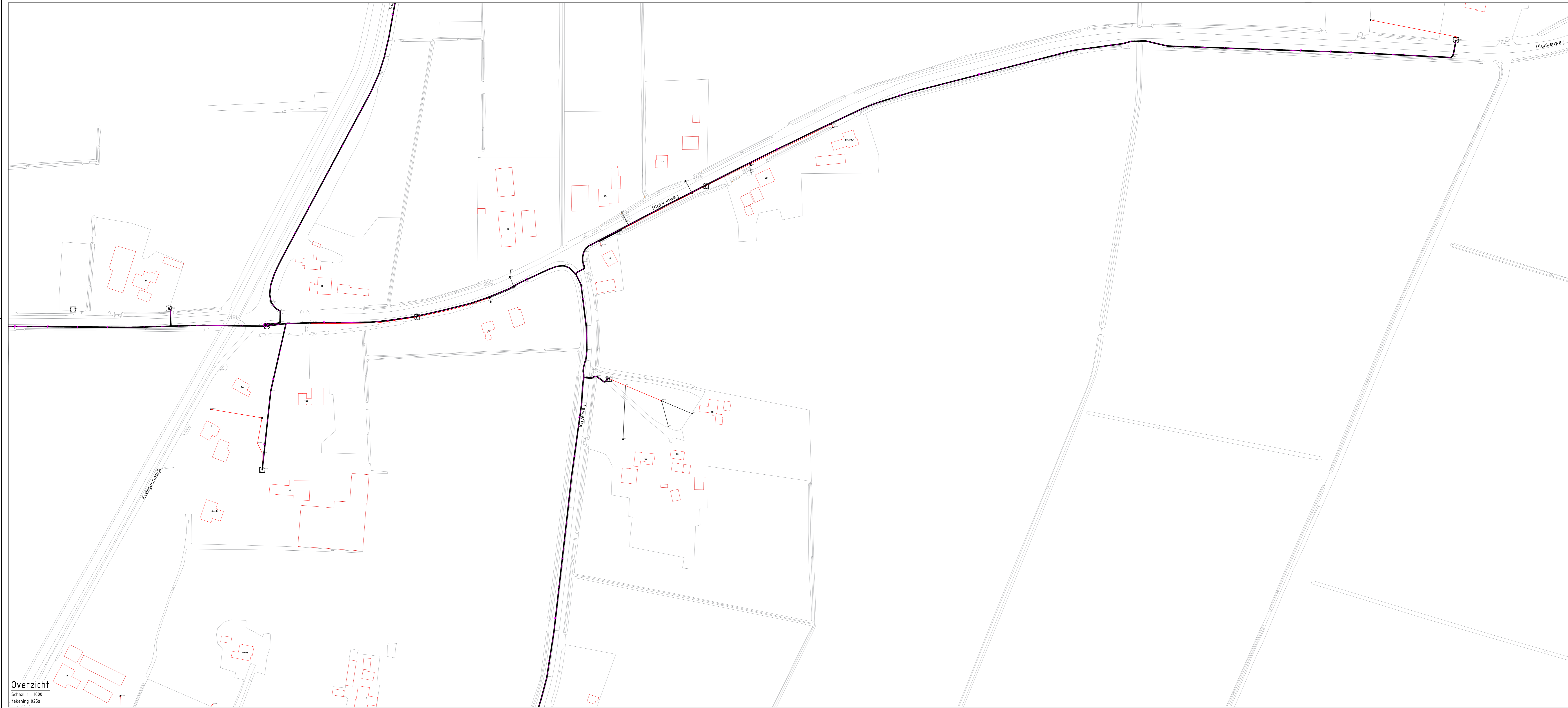
Overzicht Schaal 1: 1000 Tekening 025a